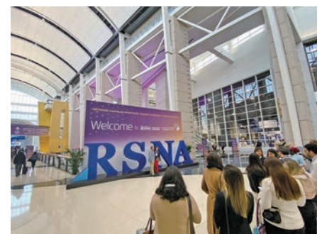
RSNA 会場