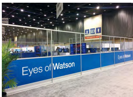
図2 Eyes of Watson IBM社のAI(人工知能)コンテンツのデモブース