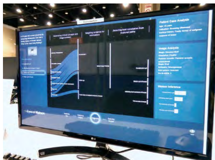
“Eyes of Watson” のデモンストレーション